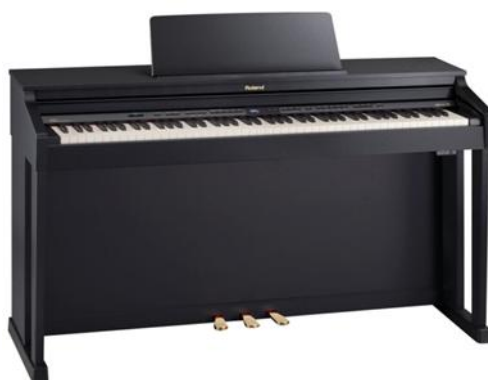
Roland HP SuperNATURAL digitalklaver

Bruno Christensen og sønner fra 2002 Et orgel er altid specialbygget til en kirke. Alle dele er fremstillet på orgelbyggerens værksted i samarbejde mellem orgelbygger og arkitekt. Senere er orglet færdigmonteret i kirken og i klangfylde tilpasset rummets akustik. Orglet har 12 stemmer fordelt på 2 manualer og pedal. I alt er der 746 piber. Orglet har følgende disposition: Hovedværk: Principal 8 - Rørfløje 8 – Oktav 4 – Gemshorn 2 – Mixtur 2-3 kor Svelleværk: Gedakt 8 – Principal 4 – Rørfløjte 4 – Oktav 2 – Nasat 1 1/3 – Krumhorn 8 – Tremolo Pedal: Subbas 16