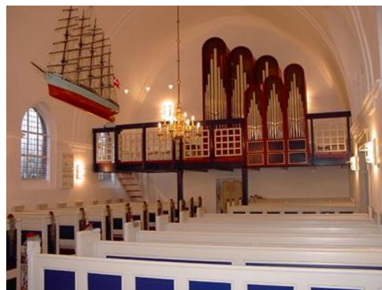
Orglet i Lyngså Kirke:

Bruno Christensen og sønner fra 1979 Orglet har 8 stemmer fordelt på 1 manual og pedal. Hovedværk: Principal 8 – Gedakt 8 – Salicional 8 – Oktav 4 – Rørfløjte 4 – Spidsfløjte 2 – Mixtur 3 kor. Pedal: Subbas 16.